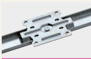
サーッと、なめらかに動く マルチラインモーション