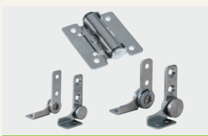
ピタッと、どこでも止まる フリーストップモーション