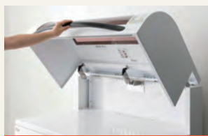
ふわっと、かるがる開く アシストモーション