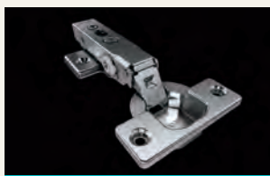
ずーっと、ゆっくり動く ソフトモーション