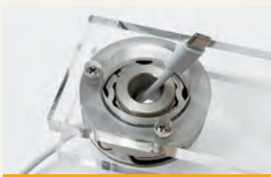
カチッと、はまって止まる クリックモーション