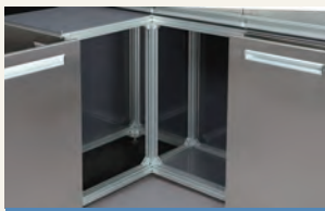
フイッと、あちこち開く ユニークモーション