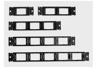
プレート取付枠 (DMF-B型)