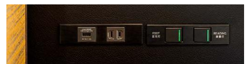
コンセントプレートシリーズ採用事例：ホテル