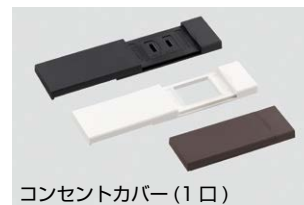
コンセントカバー (1口)

カラーバリエーションはブラック、ホワイト、ブラウンをご用意。金属製のカバーも現在開発中です。