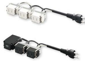
結線済コンセント (DM-A型、DM-AU型)

また配線器具では、電気工事が不要でコンセントに直接差し込んで使用できる結線済コンセントもあります。