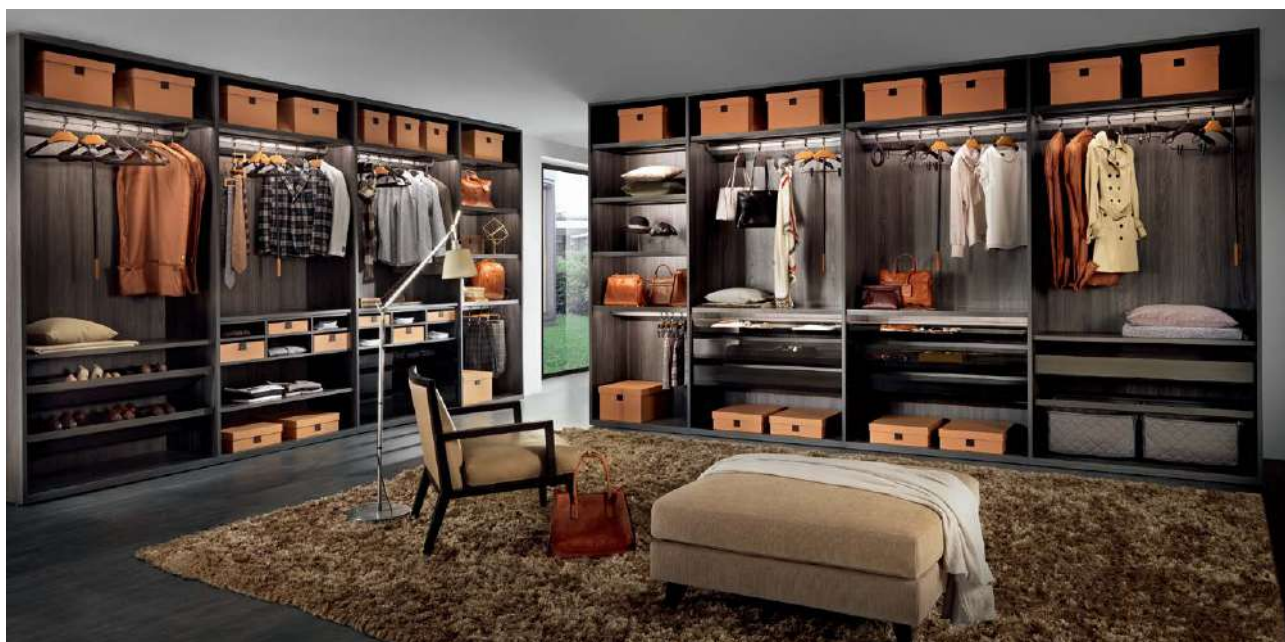
ラグジュアリー空間をコーディネート ¥6,000,000 (参考価格) ●使用製品：ハンガー、ボックス、ジュエリートレイ、ウォッチホルダートレイ、シェルフ、トレイ等