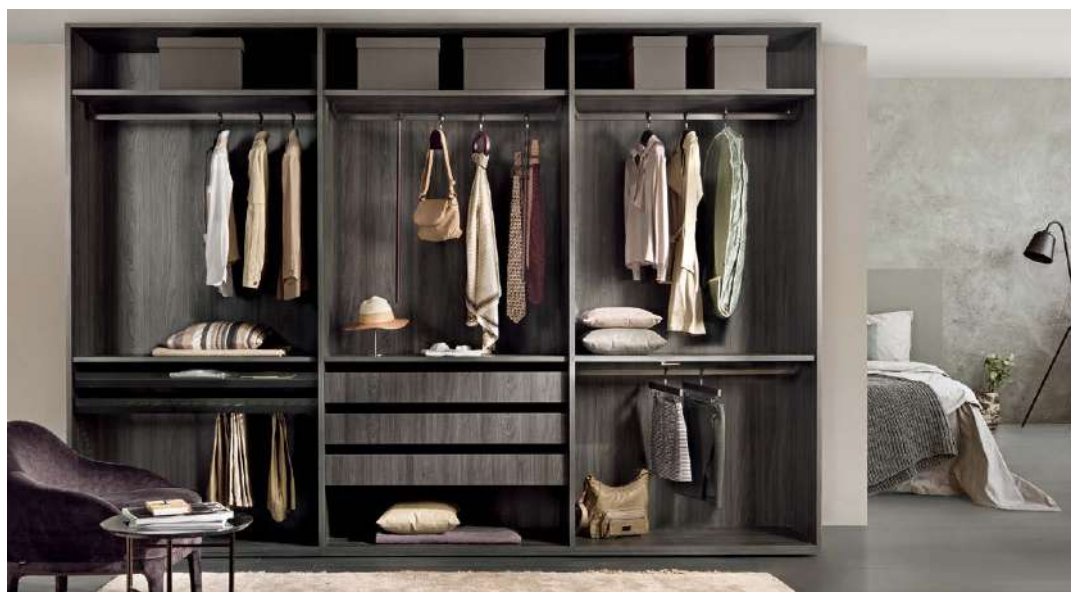
ライトな空間でコーディネートする ¥1,100,000 (参考価格) ●使用製品：ハンガー、ボックス、ウォッチホルダートレイ、シェルフ等