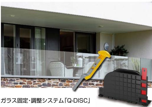
ガラス固定・調整システム「Q-DISC」

ガラスフェンスを世界最速 * で設置できます。一般的なガラスフェンスは、施工に最低 1 日かかりますが、本製品は、Q-railing 社が開発したガラス固定・調整システム「Q-DISC」により、30 分(ガラスフェンス 1m あたり)で設置ができます。