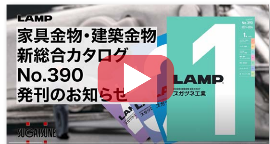
本カタログのポイントを動画でご覧いただけます。 画像をクリックすると動画を再生します。

本カタログは、本体4巻(計3648頁)と別冊価格表で構成され、商品点数は、約12,000点に上ります。ハンドル・フックなどの内装金物、丁番・スライドレールをはじめとした家具金物、スイッチ・コンセントプレートや家具用LED照明などの電材、引戸用クローザーといった建具金物など、36カテゴリの製品群を掲載しています。