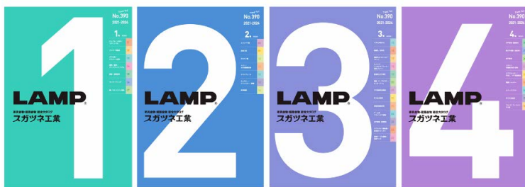
No.390 カタログ1～4巻の表紙。 画像をクリックするとデジタルブックが開きます。

家具金物・建築金物の総合メーカーであるスガツネ工業株式会社(所在地:東京都千代田区、代表取締役社長:菅佐原 純)は、「総合カタログ(家具金物・建築金物)No.390 2021-2024年」を9月16日に発行いたしました。同日より、デジタルブック版カタログも弊社WEBサイトで公開しております。ご請求によるカタログ発送は10月中旬より開始予定です。