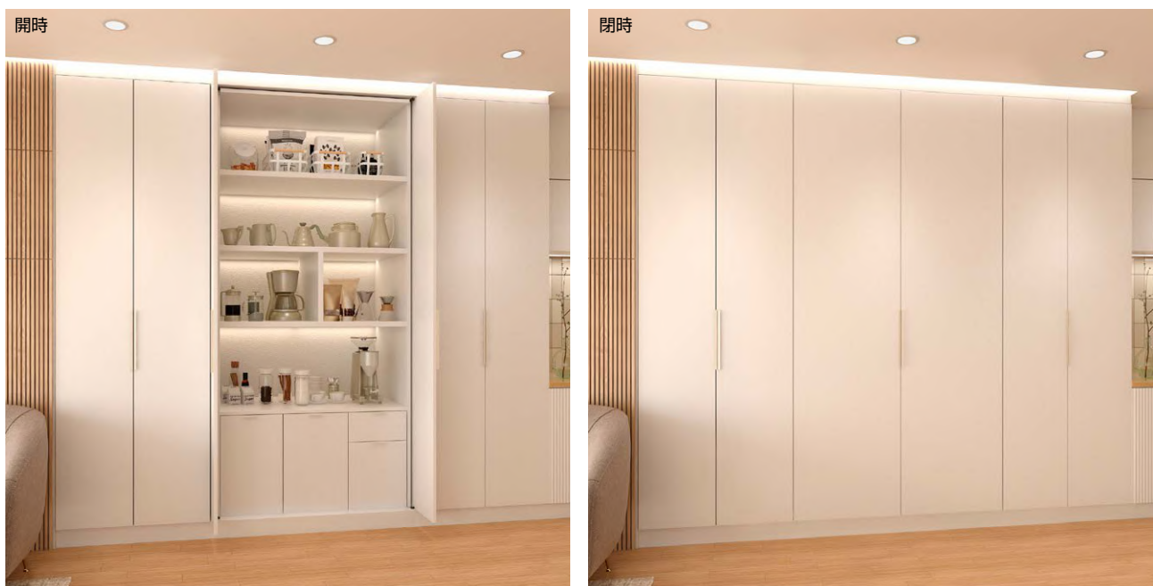
ALT-ST20 型 かぶせ仕様 施工イメージ

本品の発売によって、ALT シリーズ全体で対応できる扉サイズの範囲が広がり、より様々な場面で垂直収納扉が採用できるようになりました。