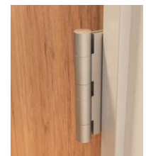
旗丁番は軸がでっぱり外側から見えてしまう