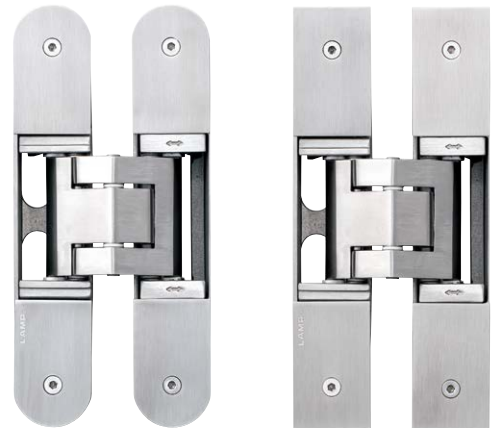
角型ねじカバー使用時 (オプション)