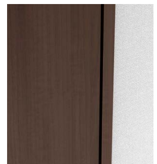
扉閉時：丁番が見えなくなる