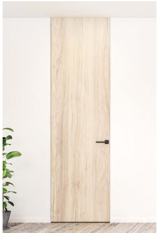
施工イメージ（扉はお客様でご用意ください）

一般的な枠は決まった壁厚しか対応できないのに対し、本品は 114 ～ 145mm といったさまざまな壁厚に取付可能です。また、クロス巻き込み仕様にも対応します。