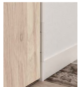
枠の色はブラックとホワイトをご用意しております。