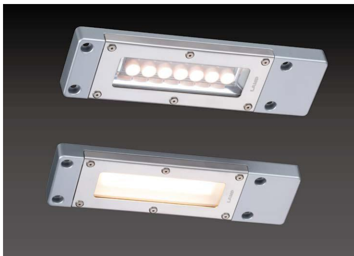
上：中角タイプ 下：広角タイプ

産業機器用機構部品の総合メーカー、スガツネ工業株式会社（所在地：東京都千代田区、代表取締役社長：菅佐原 純）は、LED タフライト SL-FL 型 を 2 月 27 日に発売しました。本品は防水性や防油性などに優れ、演色性も高いため、食品を照らすオープンキッチンやフライヤーなどの業務用レンジフードにおすすめです。