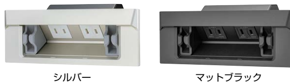
カバーの部品 + コンセントのセット (組立後イメージ)