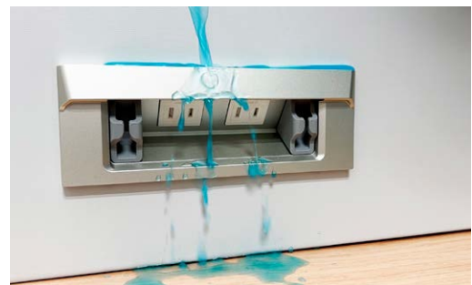
垂れてくる水からコンセント部を守ります