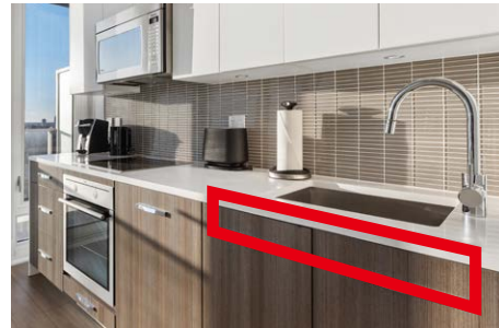
キッチンのシンク前などに取り付けます