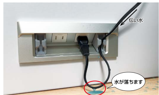
フックにコードを掛けることで、コンセント部への伝い水を防止します