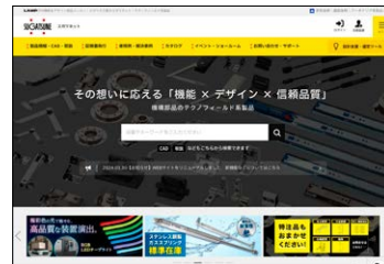
産業機器用部品トップページ