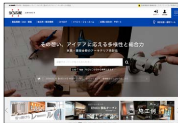
家具金物・建築金物トップページ