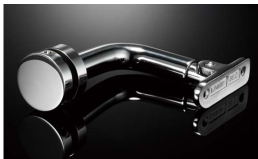
丁寧に磨き上げられた、鏡面研磨仕上げ