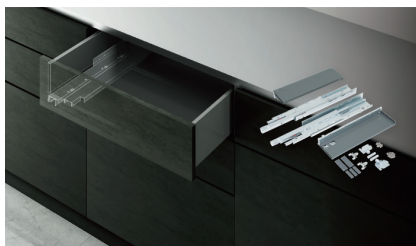
アンダーマウントレール