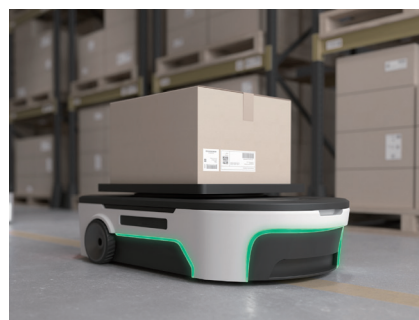
AGV（無人搬送車）の使用イメージ