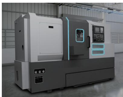
工作機械、産業機器での使用イメージ